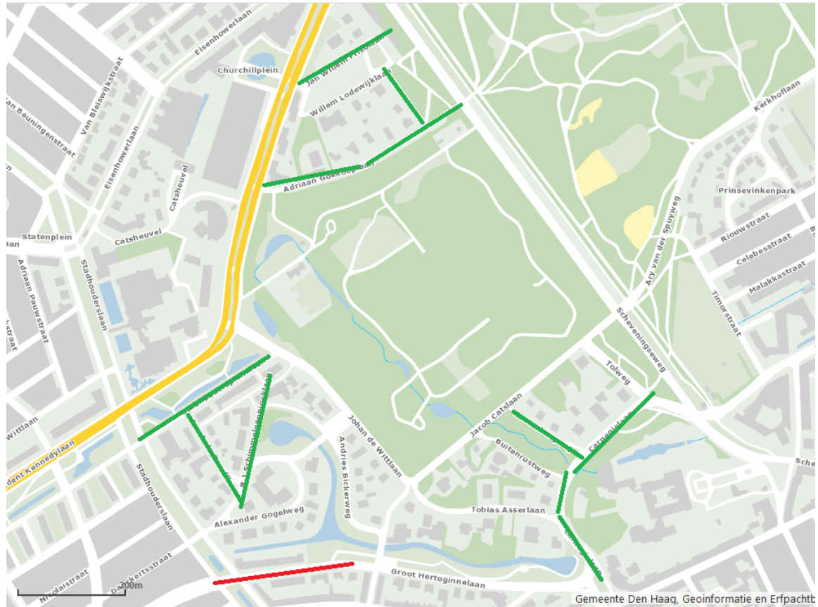
Uitkomsten op de vraag ‘Bent u van mening dat betaald parkeren moet worden ingevoerd in Zorgvliet?’ per straat

Rood = tegen Geel = neutraal Groen = voor