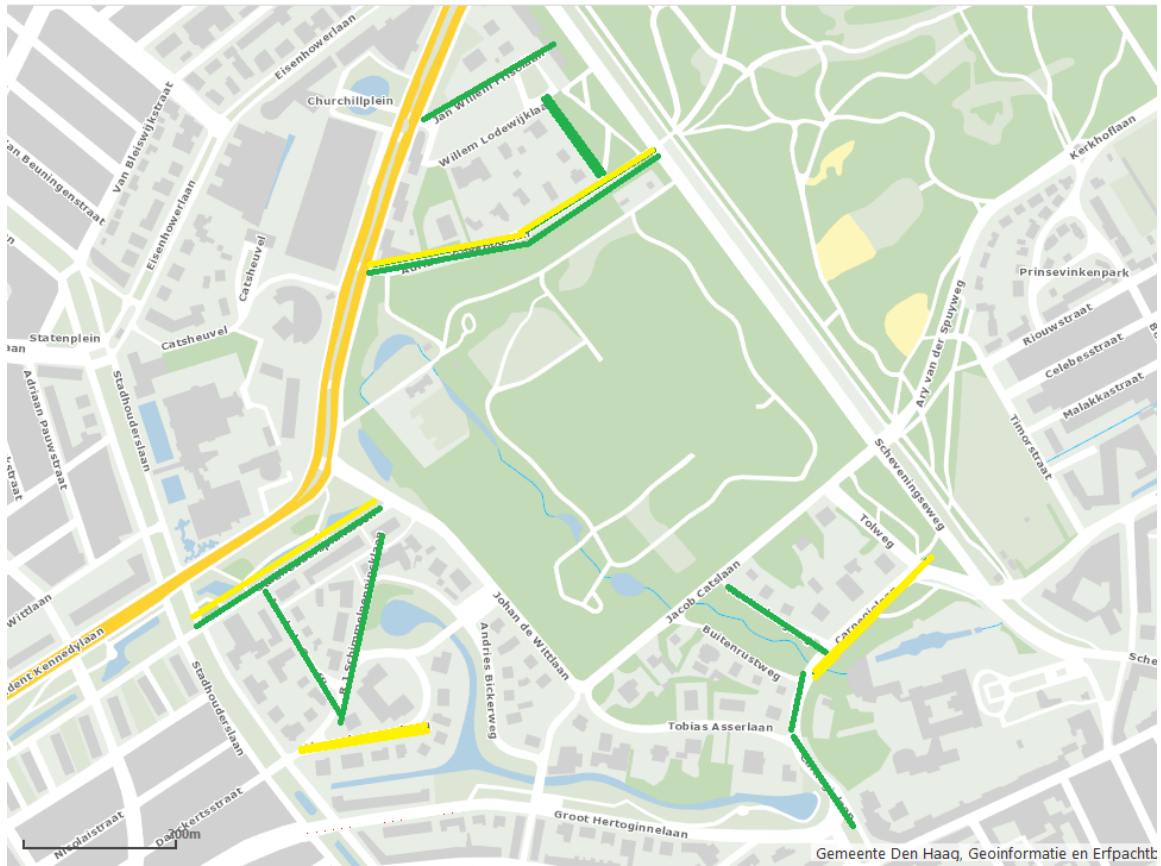
Voorkeur vergunninggebied per straat.